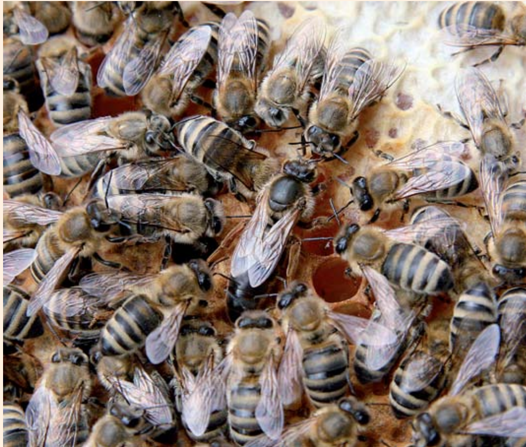
Kun geenien toimintaa ohjataan, samasta toukasta voidaan tehdä kaksi erilaista elämää: kuningatarmehiläisen (keskellä) ja työmehiläisen.

Epigeneettisten toimintojen tuntemus auttaa ymmärtämään ihmisen ja ympäristön välistä vuorovaikutusta. Se myös avaa monien sairauksien ja ominaisuuksien alkuperää. Tulevaisuudessa Diazenonin luokitus ”todennäköisesti syöpää aiheuttamattomaksi” voikin muuttua, jos syöpäriskiluokitukseen otetaan mukaan myös muita kuin suoria dna-mutaatioita aiheuttavia tekijöitä.