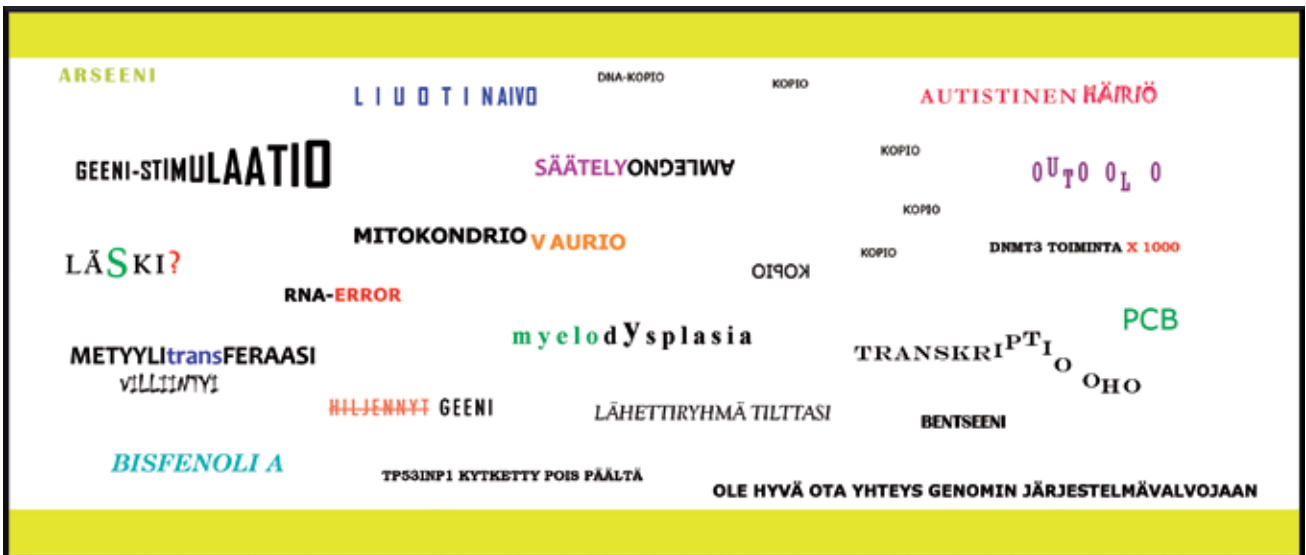
Epigeneettiset mekanismit voivat hidastaa, muuntaa, vaimentaa tai tehostaa geenien toimintaa. Häiriötilassa oleva geenien ohjausjärjestelmä tuottaa ohjelmointivirheitä: yliaktiivisuutta, sammumisia, vääräaikaisuutta ja virheluentaa.

Epigeneettisiä häiriöitä on vastikään löydetty myös ms-taudin, epilepsian ja Parkinsonin taudin taustalta. Lisäksi epigenetiikka hahmottaa autoimmunisaation – elimistön hyökkäämisen omia kudoksiaan vastaan – kaltaisten perustavanlaatuisien häiriöiden syntymekanismia.